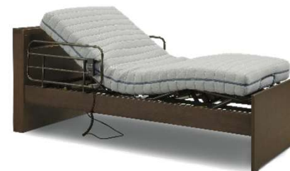
ポジション+3Dリクライニングマットレスセット