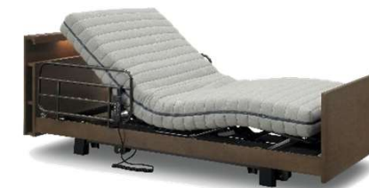
セラプレート+3Dリクライニングマットレスセット