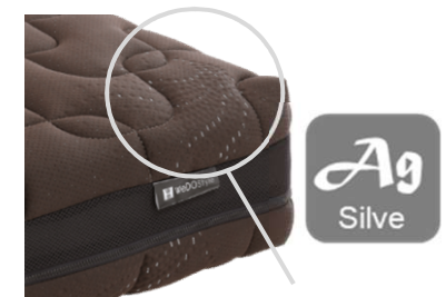
銀繊維入りニット生地使用