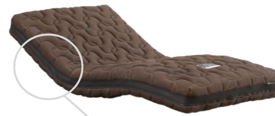
通気性バツグン! ダブルラッセル生地