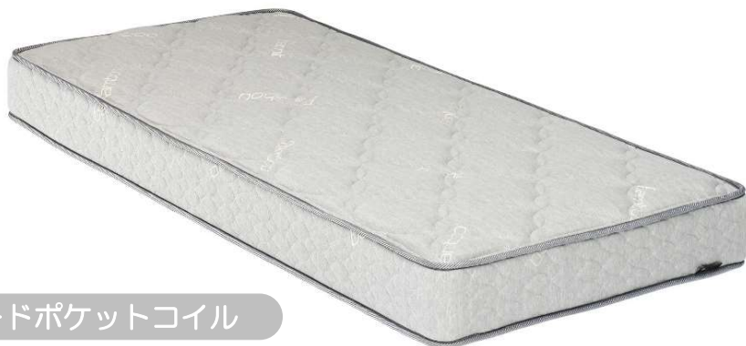
ハードポケットコイル

外装生地 ポリエステル55% 指定外繊維(竹チャコール繊維45%) スプリング構造 チドリ配列ポケットコイル6インチ 線径2.0mm 硬鋼線C種相当